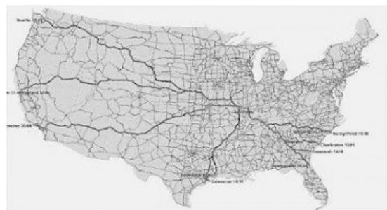
Abbildung 1. Die optimale Routung eines Straßentransports durch die USA - Die Tabelle hinter der Karte enthält über 80.000 Einträge.

weniger als einer Sekunde erledigen, auch wenn wir dem System mitteilen, dass in Kansas City und St. Louis Pausen eingelegt werden sollen. Diese Geschwindigkeit wird durch zwei Einflüsse ermöglicht – unseren Algorithmus und die Geschwindigkeit, mit der wir die FoxPro-Tabellen durcharbeiten können, in denen die Daten über die Highways enthalten sind. Es handelt sich um mehr als 80.000 Punkte allein auf dem amerikanischen Festland“, beginnt Anurag. „Nicht nur das, wir können den Tabellen auch „on the fly“ Punkte hinzufügen oder solche löschen, die nicht länger benötigt werden. Stellen Sie sich vor, eine Region wird überflutet. Das ist ein Beispiel dafür.“ Wir probieren es aus. Die Lösungsmöglichkeiten erscheinen, sobald die erforderlichen Angaben gemacht worden sind. Obwohl bereits von einem „Bruchteil einer Sekunde“ die Rede war, erscheint mir dies sehr schnell.