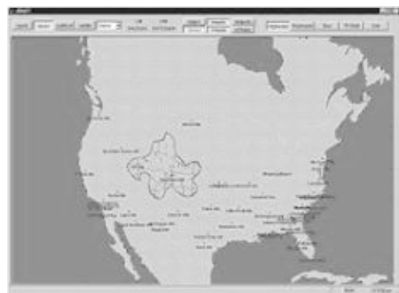
Abbildung 3. Ausschließen nach dem Markieren - Dem Modell kann mitgeteilt werden, dass alle Transportknoten innerhalb des markierten Bereichs ignoriert werden sollen.

Nachdem dies erledigt ist führt Jones aus, dass „es jetzt einfach ist, die Links und Knoten der Highways innerhalb dieses Bereichs zu extrahieren und sie auf der Karte anzuzeigen. Jetzt können wir dem Modell mitteilen, dass diese Knoten und Links ignoriert werden sollen. Dadurch wird der Bereich, der die Probleme hervorruft ausgeklammert und das Transportproblem gelöst. Auch dies haben wir in Visual FoxPro verwirklicht.“ (Abbildung 3)