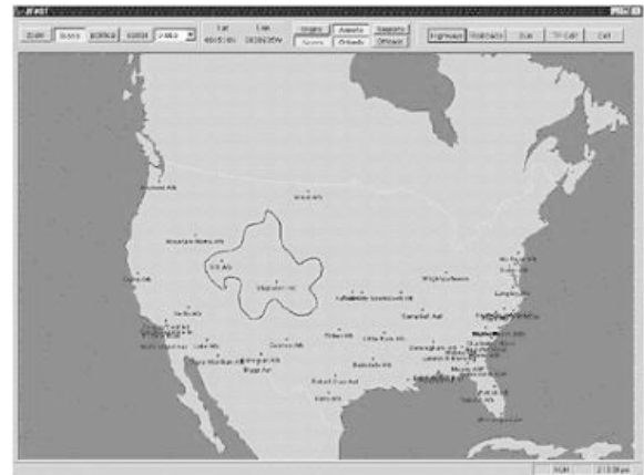
Abbildung 2. „Einfangen“ eines Teils der Karte - Der Anwender kann einen Teil der Karte mit der Maus auswählen.

Jones seine Maus und kreist im mittleren Westen einen Bereich ein, der durch den Sturm betroffen ist (Abbildung 2).